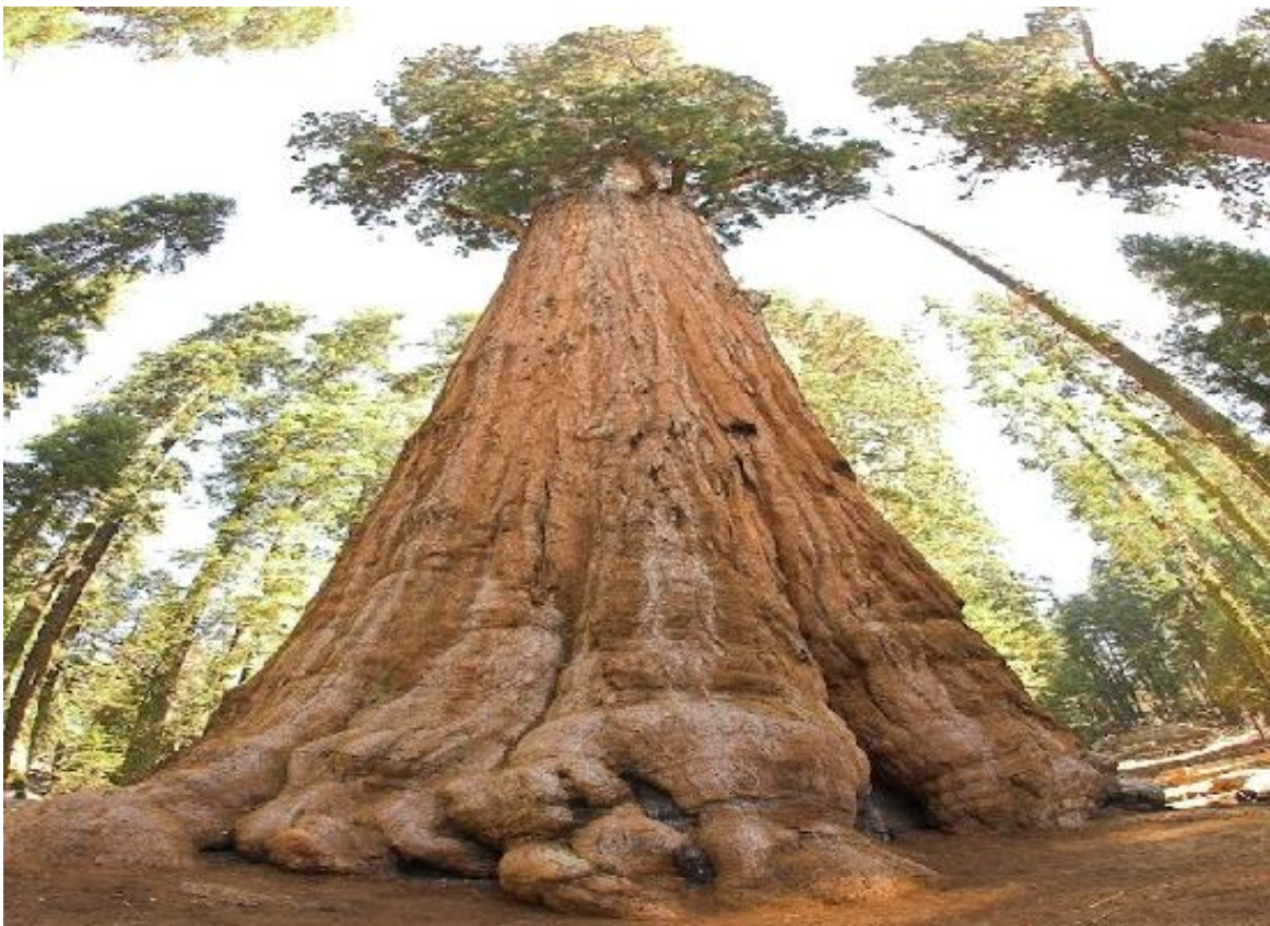
Dit is de oudste boom ter wereld van bijna vijfduizend jaar.