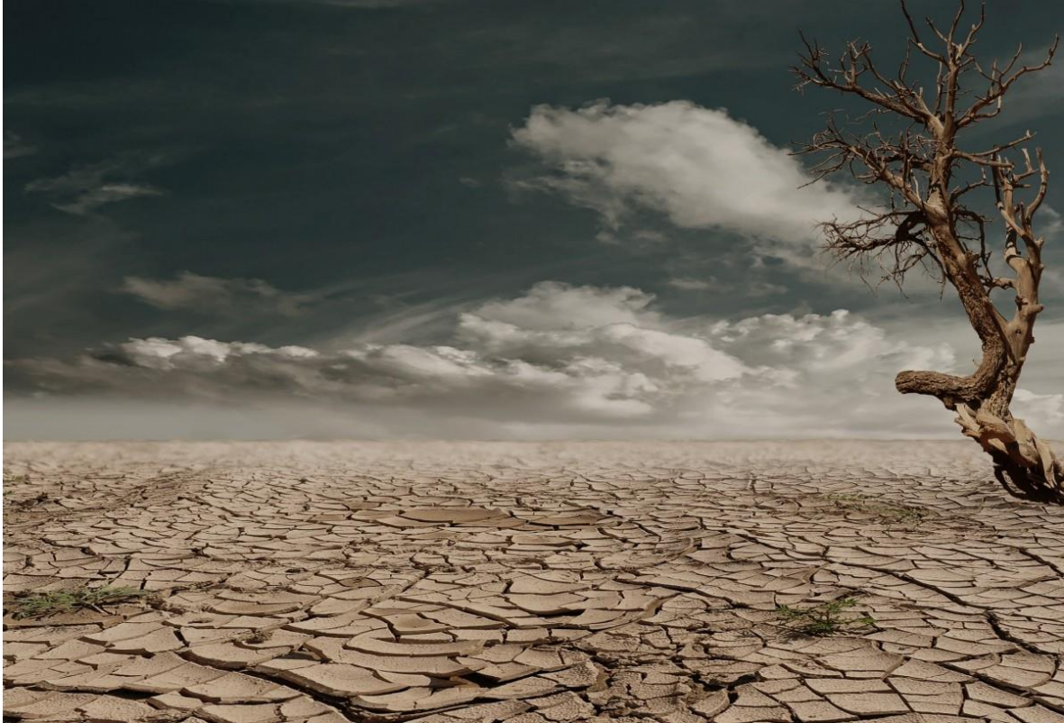
Hier stond tien jaar geleden nog een bos.